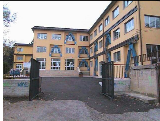
Scuola Primaria Nicola Stigliani