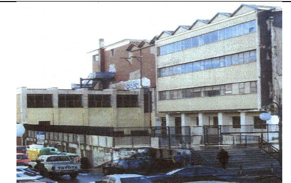
Scuola Media Francesco Torraca