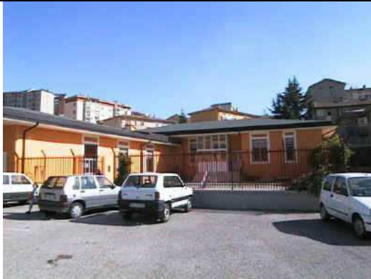
Scuola dell'Infanzia Rione Lucania