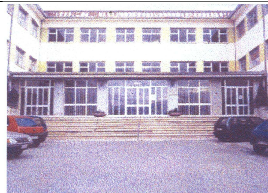
Scuola Media Giacomo Leopardi