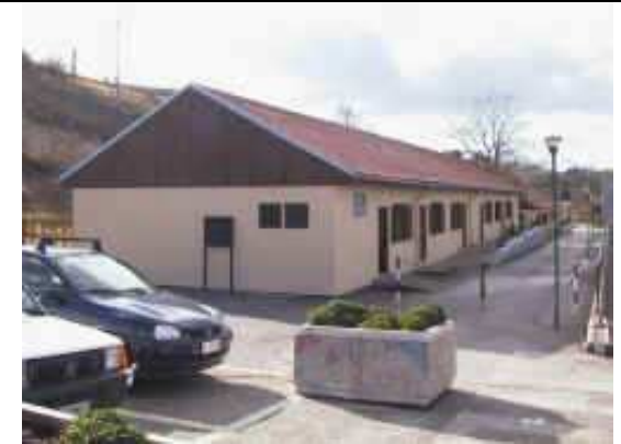
Scuola Primaria Gianni Rodari