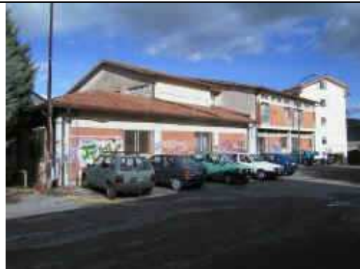
Scuola Primaria Giacinto Albini